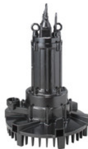
Tauchbelüfter - selbstansaugend - wartungsarm - einfache Installation