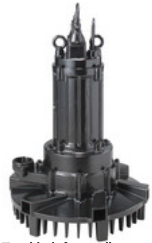
Tauchbelüfter - selbstansaugend - wartungsarm - einfache Installation