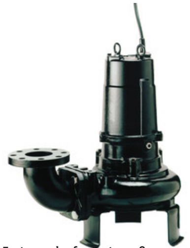
Freistromlaufrad mit großem Pumpengehäuse, 4-poliger Motor, verstopfungsfreies Pumpen.