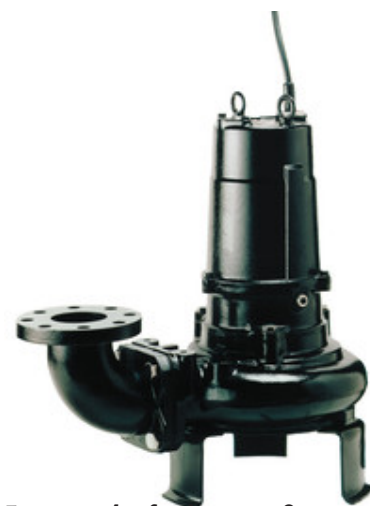
Freistromlaufrad mit großem Pumpengehäuse, 4-poliger Motor, verstopfungsfreies Pumpen.